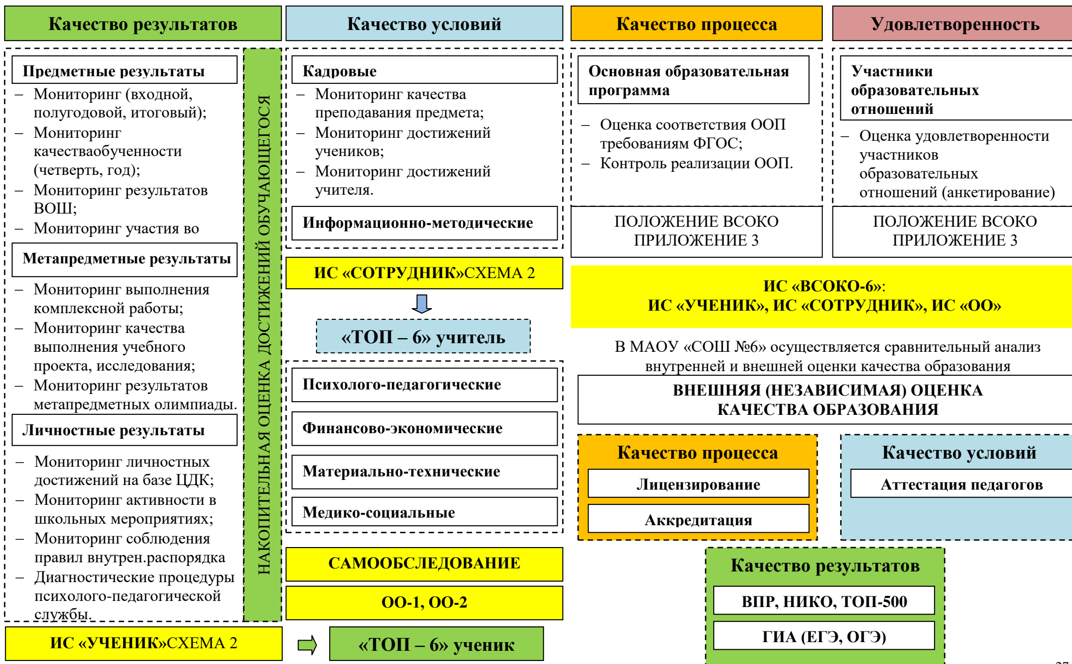
СХЕМА 1. ВНУТРЕННЯЯ СИСТЕМА ОЦЕНКИ КАЧЕСТВА ОБРАЗОВАНИЯ МАОУ «СОШ №6»